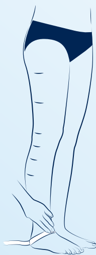
cY tas runt hälen och vristen.