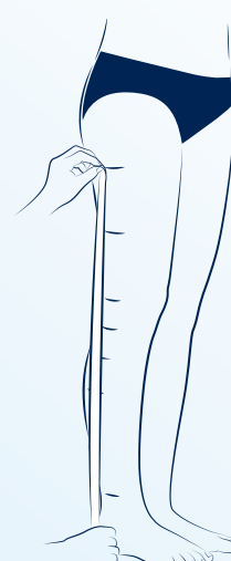
Längdmåtten tas från golvet upp till varje mätpunkt längs benets utsida. Följ ej benets kontur.