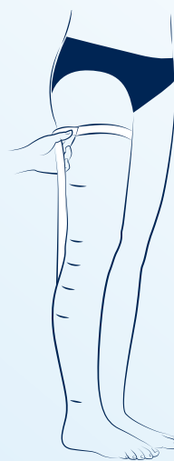
cG tas runt låret vid glutealvecket