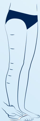
cA tas runt foten vid tåbasen